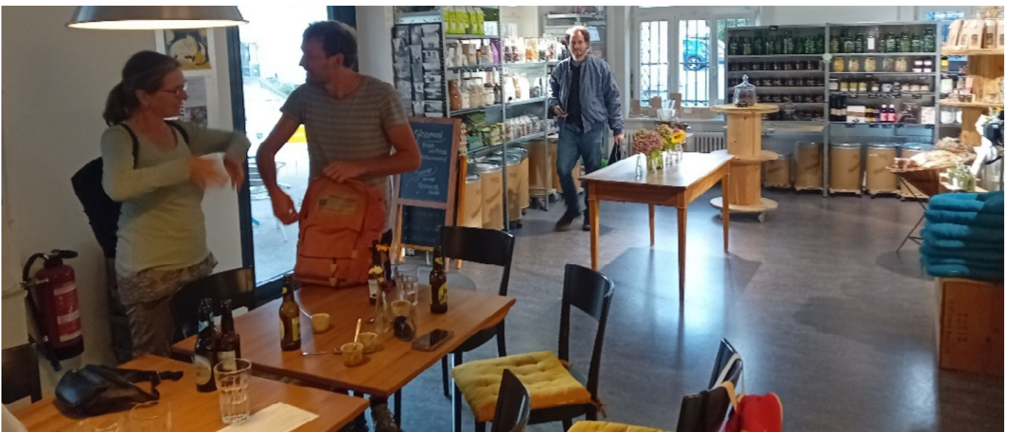
Apéro bei der Genossenschaft ZWIBOL in Wädenswil