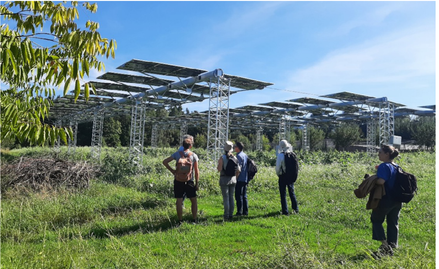
Agrophotovoltaikanlage auf dem Campus Grüntal