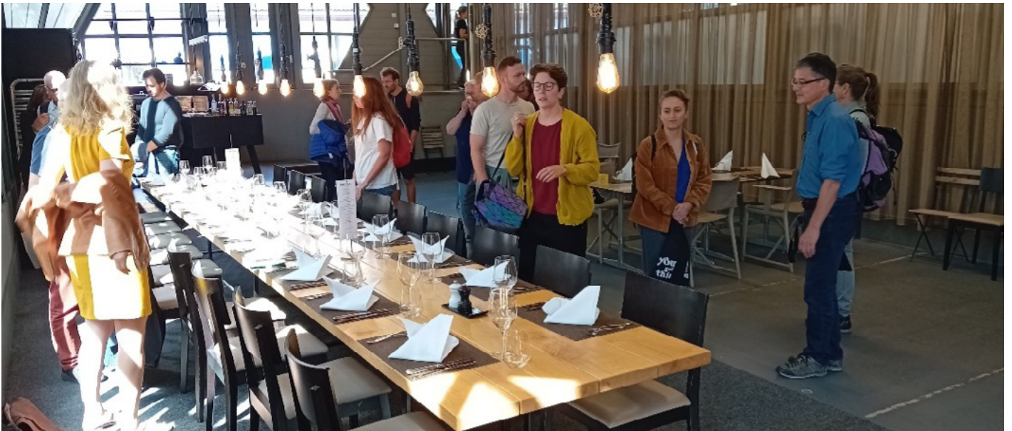
Mittagessen im Restaurant Boccia