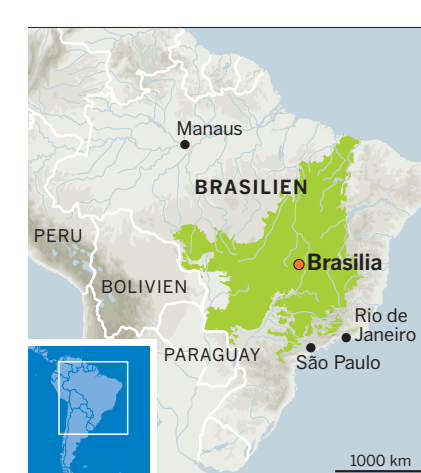
Cerrado-Savannen in Brasilien

Preis und ist nicht für minimale Produzentenprämien auf den marktüblichen Preis zu haben, wie es beispielsweise das neue, von Schweizer Grossverteilern, WWF und dem Handel gestützte Label «RTRS» (Round Table on Responsible Soy) erwarten lässt. Das RTRS-Label stellt nämlich kaum Anforderungen, die über die bestehenden brasilianischen Gesetze und die übliche derzeitige Praxis hinausgehen, und ist weit entfernt beispielsweise vom Schweizer Standard für Integrierte Produktion.