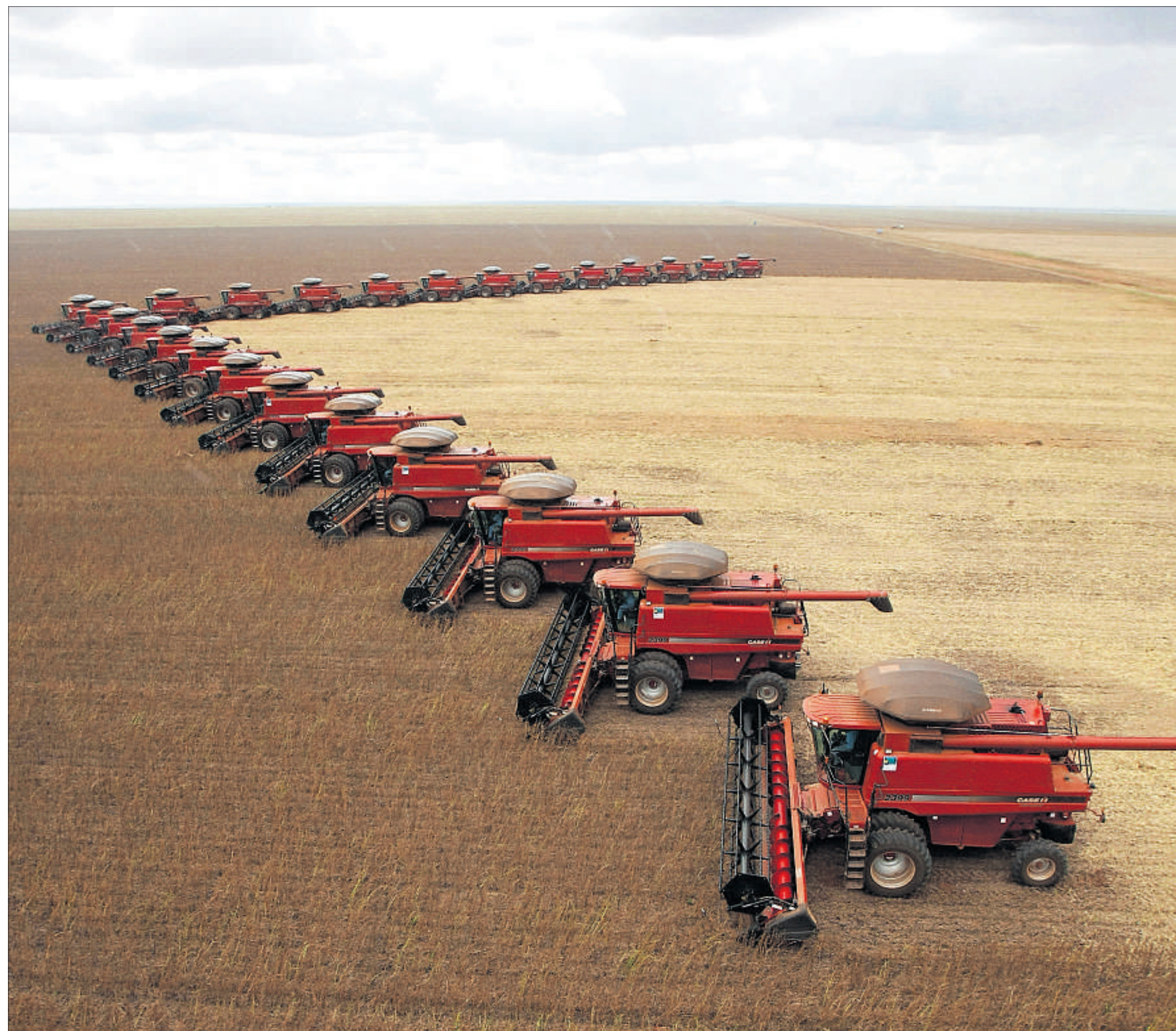
Soja-Ernte in der Savanne. Brasilien ist nach den USA der grösste Soja-Produzent der Welt. (Tangara da Serra, 5. März 2009)

Soja wird zum grössten Teil als Tierfutter angebaut. Die Nachfrage steigt seit den 1980er Jahren steil an.