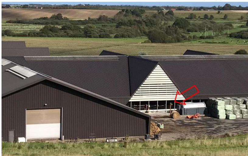
Konsequenter Vollzug ohne Schlupflöcher: Eine von der Kontrollbehörde direkt ansteuerbare Kamera im Tank (vor dem modernen Offenstall rechts unten im Bild) dokumentiert, ob die zur Ammoniakreduktion vorgeschriebene Schwefelsäure auch tatsächlich zur Anwendung kommt.

Die Schweizer Agrarpolitik muss das Rad nicht neu erfinden, um die vielen, seit Jahrzehnten vor sich hergeschobenen Umweltprobleme endlich zu lösen. Sie kann von Dänemark einiges lernen. Einen entsprechenden Austausch will Vision Landwirtschaft nun anschieben. In Arbeitsgruppen soll zusammen mit dänischen Spezialisten unter Einbezug interessierter Amtsstellen abgeklärt werden, wie die erfolgreichen dänischen Programme auf unser Land übertragen werden können. Dass ein solcher Austausch bisher kaum stattgefunden hat, erstaunt. „Wir haben regen Besuch aus vielen Ländern Europas und Asien. An Schweizer erinnere ich mich dagegen nicht...“ meinte Beratungsleiter Martin Hansen grinsend.