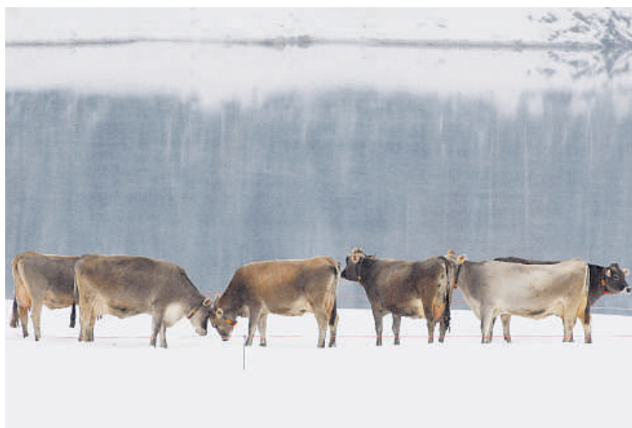
Trotz einer Verminderung der Anreize für die Tierhaltung soll der Bestand an Milchvieh etwa stabil bleiben.

Das meiste Geld, rund eine Milliarde Franken, soll in den Topf der Versorgungssicherheit fließen, die gemäss Botschaft die Produktionskapazitäten für den Fall von Versorgungsengpässen erhalten soll. Der Selbstversorgungsgrad soll laut Schneider-Ammann weiterhin rund 60 Prozent brutto betragen. Bereits 2014 soll eine substanzielle Umverteilung der Mittel stattfinden. Während die Versorgungssicherheitsbeiträge ab dann stabil bleiben, steigen die Öko-Beträge an, während gleichzeitig die Übergangsbeiträge sinken. Insgesamt verharren die wirtschaftlichen Rahmenbedingungen der Landwirt-