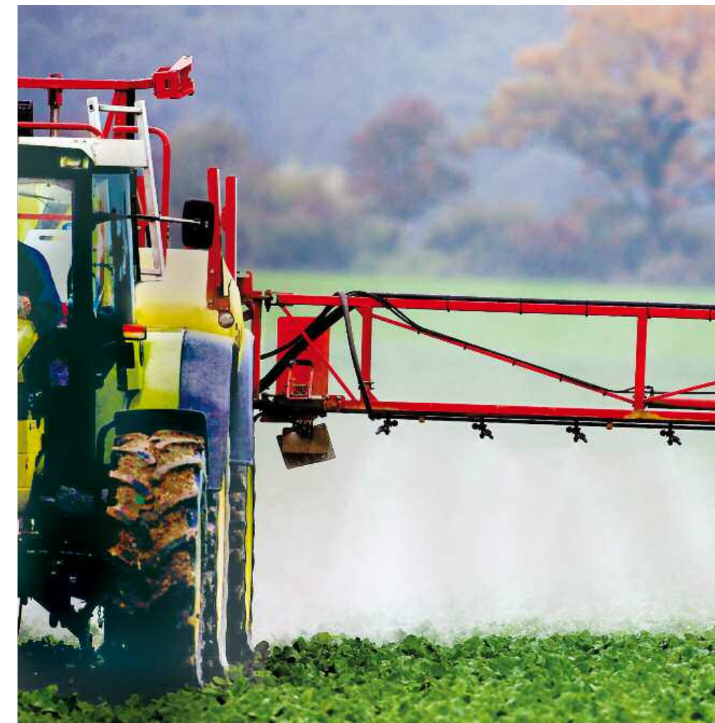
4,5 Kilogramm Pestizide pro Hektar: Die zuständigen kantonalen Ämter kontrollieren den Einsatz

■ Das Bundesamt für Landwirtschaft beauftragte letztes Jahr einige Kantone, den Einsatz von illegalen Insektiziden auf Kartoffel- und Getreideäckern zu überprüfen. Resultat: 15 der 97 kontrollierten Landwirte hatten Insektizide versprüht, die nicht zugelassen waren oder für die sie keine Sonderbewilligung hatten. Bosshard rechnet mit zusätzlichen Missbräuchen: «Hätten die Tester nach weiteren illegalen Pestiziden gesucht, hätten sie vermutlich weitere gefunden.» Das Bundesamt wiederholte in diesem Jahr die Stichproben. Ergebnisse liegen noch nicht vor.